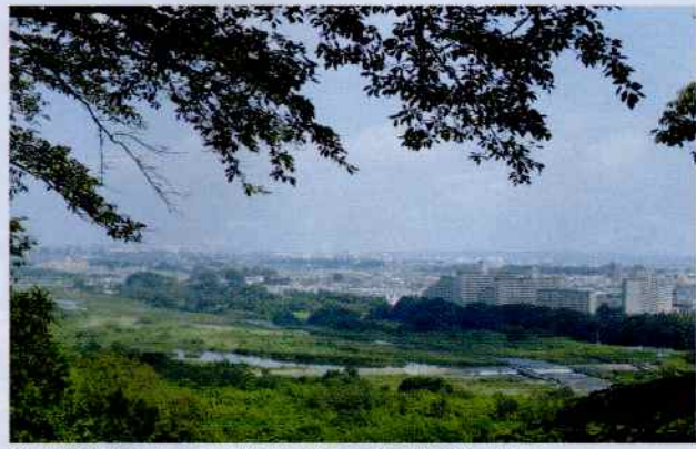
滝山城跡中の丸から多摩川、狭山丘陵が見晴らせる