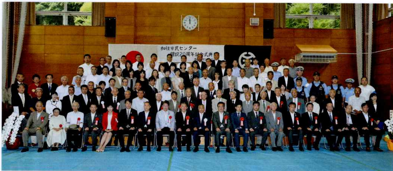
20周年式典ご来賓の方々を中心にスタッフ一同