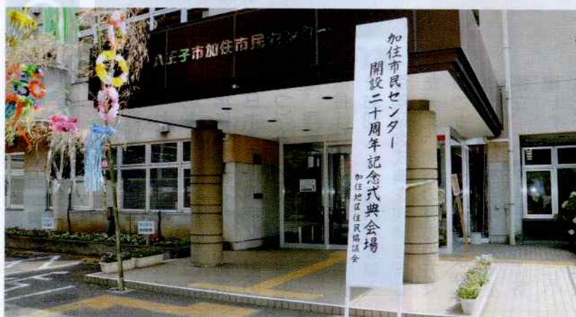
式典とともに七夕飾りの準備も整いました。