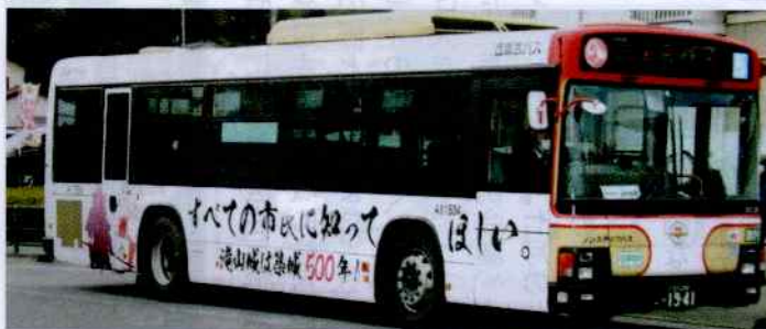
築城500年記念バスが走りました。

地域が誇る、滝山城跡は、昨年築城五百年を迎え、二〇一七年に続日本百名城に指定され、さらに、二〇二一年に東京都として初めての日本遺産（構成文化財の一つ）として認定されました。同年三月には、八王子市長はじめ、多くのご来賓をお迎えし、滝山城築城五百年記念式典を開催しました。また、地域の有志の方々のご支援、ご協力により、滝山城築城五百年記念碑を建立、これを八王子市に寄贈いたしました。さらに、八王子市観光課との協力に