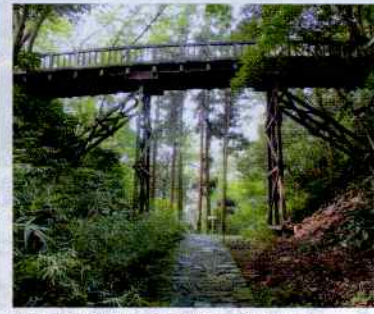
深い堀切にかかる引橋 (滝山城跡)