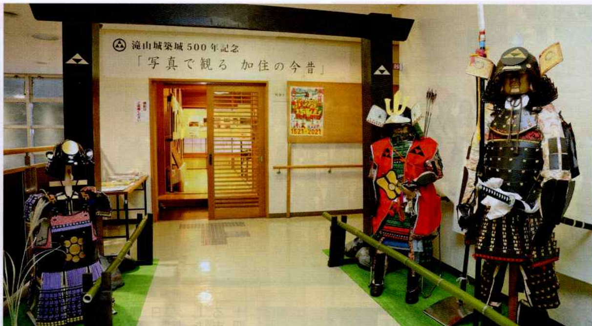
甲冑を飾ってみました、勇ましいですね。