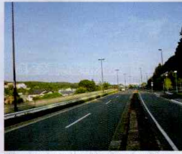
まるで高速道路のような新滝山街道