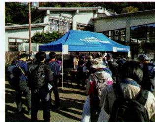
災害ボランティアセンターの運営