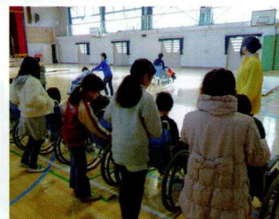
小学校での福祉体験学習