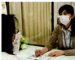
身近な地域の相談場所