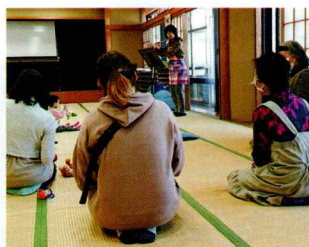
子育てサロン等への助成