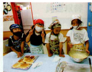
学童保育所の運営