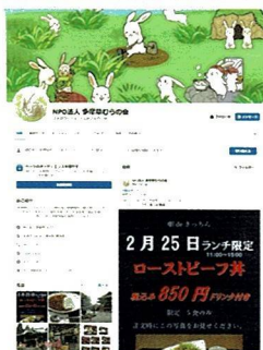
認定 NPO 法人多摩草むらの会 facebook