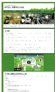
認定 NPO 法人多摩草むらの会

認定 NPO 法人多摩草むらの会および社会福祉法人草むらでは、ホームページで広報活動を行っています。また、Facebook でもタイムリーな情報発信を行っています。イベントなどの最新情報も掲載されていますので、ぜひ御高覧下さい。