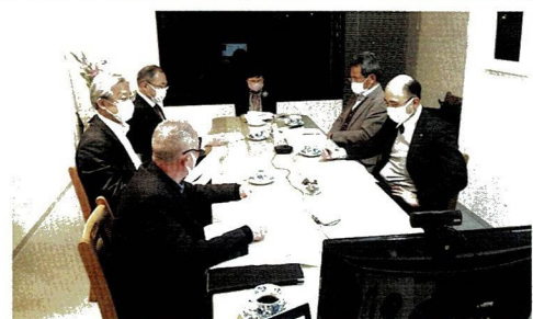
積極的な議論を行いました

会議では、第三四半期の成果と各種事業の進捗状況を報告、内容についてご審議いただきました。さらに、今後の運営について皆様から重要なお助言を頂きました。