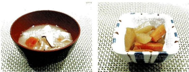
臭だくさん味噌汁