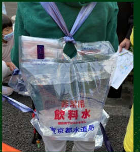
リュック型給水袋