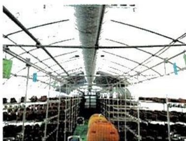
椎茸の快適環境を実現