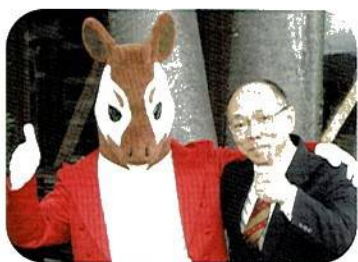
指揮者のオカピと筆者

皆さんは「ズーラシアンブラス」というのをご存知でしょうか？ よこはま動物園ズーラシアには沢山の動物がいます。その中の何種類かの着ぐるみをきて金管楽器を演奏するグループです。そして「サクソフォックス」という4匹のキツネがサクソの演奏をします。更には「ズーラシアンフィルハーモニーオーケストラ」まであるのです。まあ、いずれももの凄い、素晴らしい演奏です。あなたも音楽家の端くれになったのだから良い演奏を聴きに行かなければと、奥さんに後押しをされて出かけたのですが、正直、着ぐるみだからこども騙しだろうと思って演奏会場に入ったものの、すっかりはまってしまい、今では家族ぐるみで追っかけをしています。皆さん、ぜひこの素晴らしい演奏を聴きに行ってください。動物園ではなく各地公会堂などで演奏しています。貴方もはまりますよ！