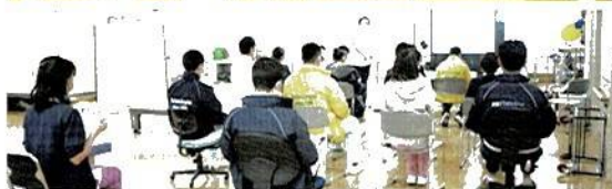
充実した設備とスタッフで対応しています