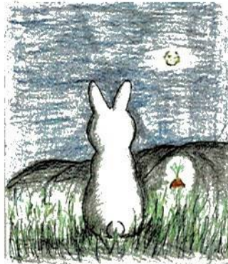
ロマンチストのウサギさん