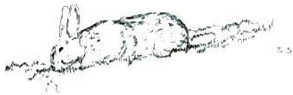
いたずらだけど実は繊細なウサギさん