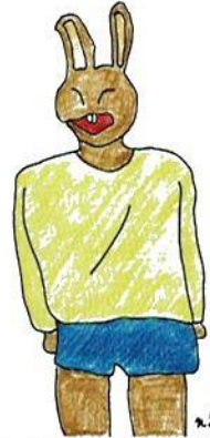
子どもの心を忘れないウサギさん