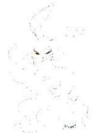
神秘的なウサギさん