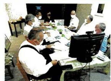
活発な議論が交わされました

会議では、四半期の成果と事業進捗状況の報告について審議いただき、さまざまな課題に対応できる強固な経営基盤の構築と利用者支援の更なる充実に向けた今後の運営方針について議論を行いました。