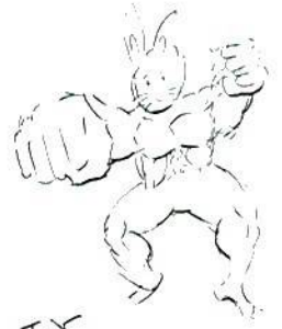
卒業間近?! 鍛えているウサギさん