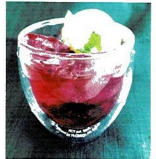
赤しそシロップでジュースを