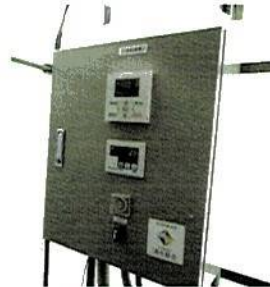
温度と水を一元管理