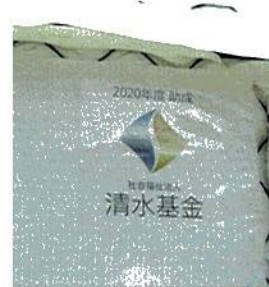
ハウスの側面には助成元の清水基金様のロゴが