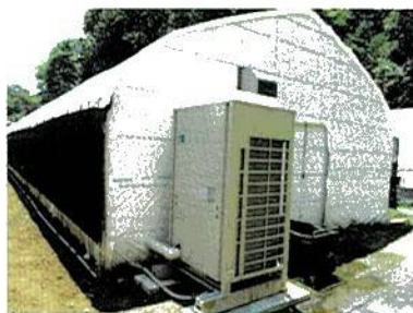
新しいシイタケハウスの外観